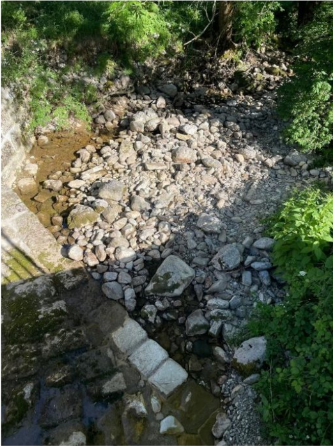
Lindar à Aillon-le-Jeune, le 17 juin