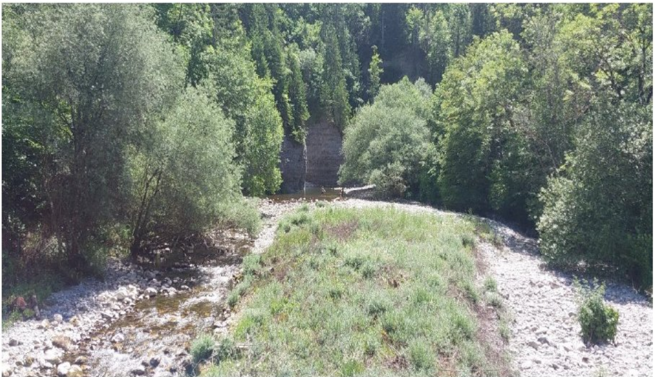
Nant d'Aillon au niveau du pont du parking de la cascade de Pissieu