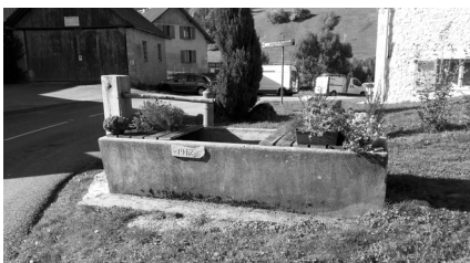
Bassin du Désert

Les habitants des hameaux du Désert et des Minets ont donné de leur temps et de leur énergie pour restaurer des bassins. Leur travail a permis de sauvegarder des éléments essentiels du patrimoine de la commune.