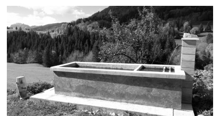
Bassin des Minets

Les habitants des hameaux du Désert et des Minets ont donné de leur temps et de leur énergie pour restaurer des bassins. Leur travail a permis de sauvegarder des éléments essentiels du patrimoine de la commune.