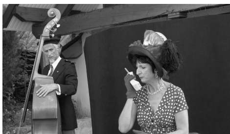
La Compagnie «Le Serpent à Plumes »