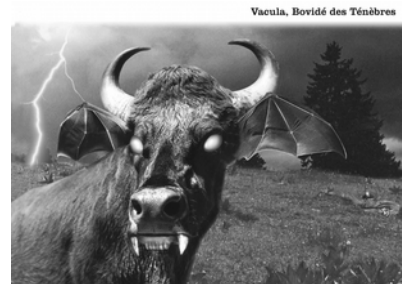
Vacula © Plonk & Replonk

Exposition en accès libre aux heures d'ouverture du musée.