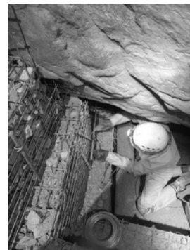
Travaux à la Balme à Collomb

Grâce à ces aménagements, les visites de la grotte peuvent être maintenues lors des fêtes préhistoriques proposées par le musée. D'ailleurs, la 4 ème édition de la Fête Préhistorique se déroulera les 4 et 5 juillet 2020.