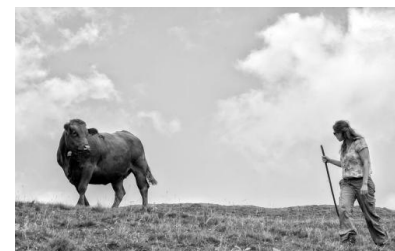
Poétique d'une estive

En accès libre aux heures d'ouverture du musée.