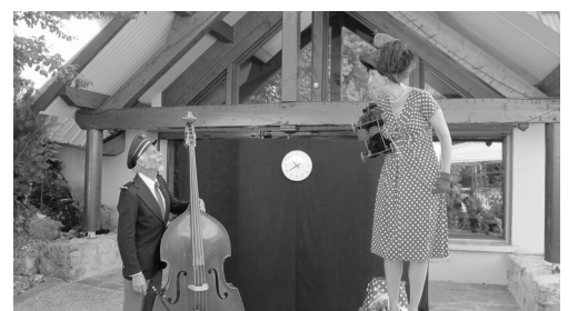
Spectacle « Faux départ »