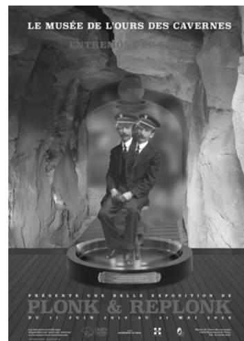
Exposition temporaire - Plonk & Replonk