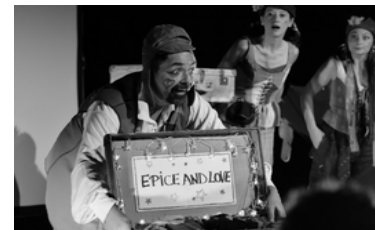
Théâtre - Voyages.