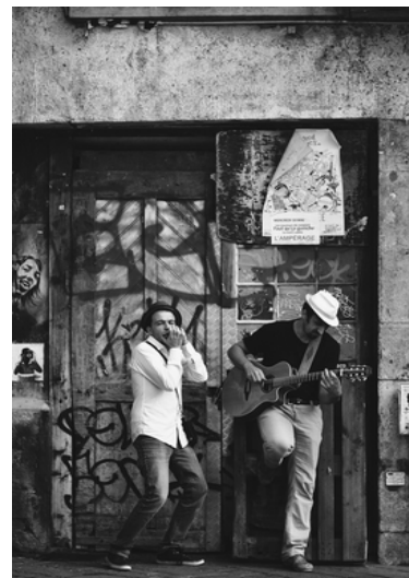
Concert - High Sensi B